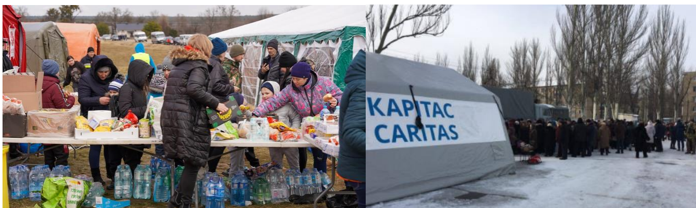
Caritas Pologne se mobilise pour accueillir les réfugiés