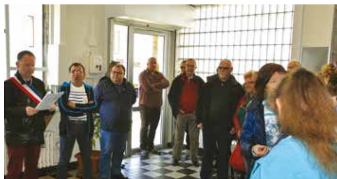
Lors de la manifestation pour le maintien de l'ouverture de la Poste

Prenant acte de la position de la municipalité, les responsables de la Poste envisagent une solution interne à la charge unique de l'entreprise : un agent de la Poste sera aussi bien facteur que guichetier.